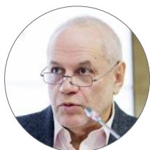
ЕВГЕНИЙ БУНИМОВИЧ уполномоченный по правам ребёнка Москва

это предложения в Федеральный закон об образовании, касающиеся школьной формы. Причём уполномоченный по правам ребёнка в г. Москве Евгений Бунимович с удивлением отметил, что его собственные представления по этому вопросу не соответствовали мнению детей. «Мне казалось, что формы вообще не должно быть, потому что так свободнее и правильнее, — отмечает Евгений Бунимович. — Но обсуждение ребят помогло выработать гораздо более тонкий и гибкий подход к этой ситуации, и после того как я отослал предложения детского совета министру, они вошли в Федеральный закон практически в неизменном виде».